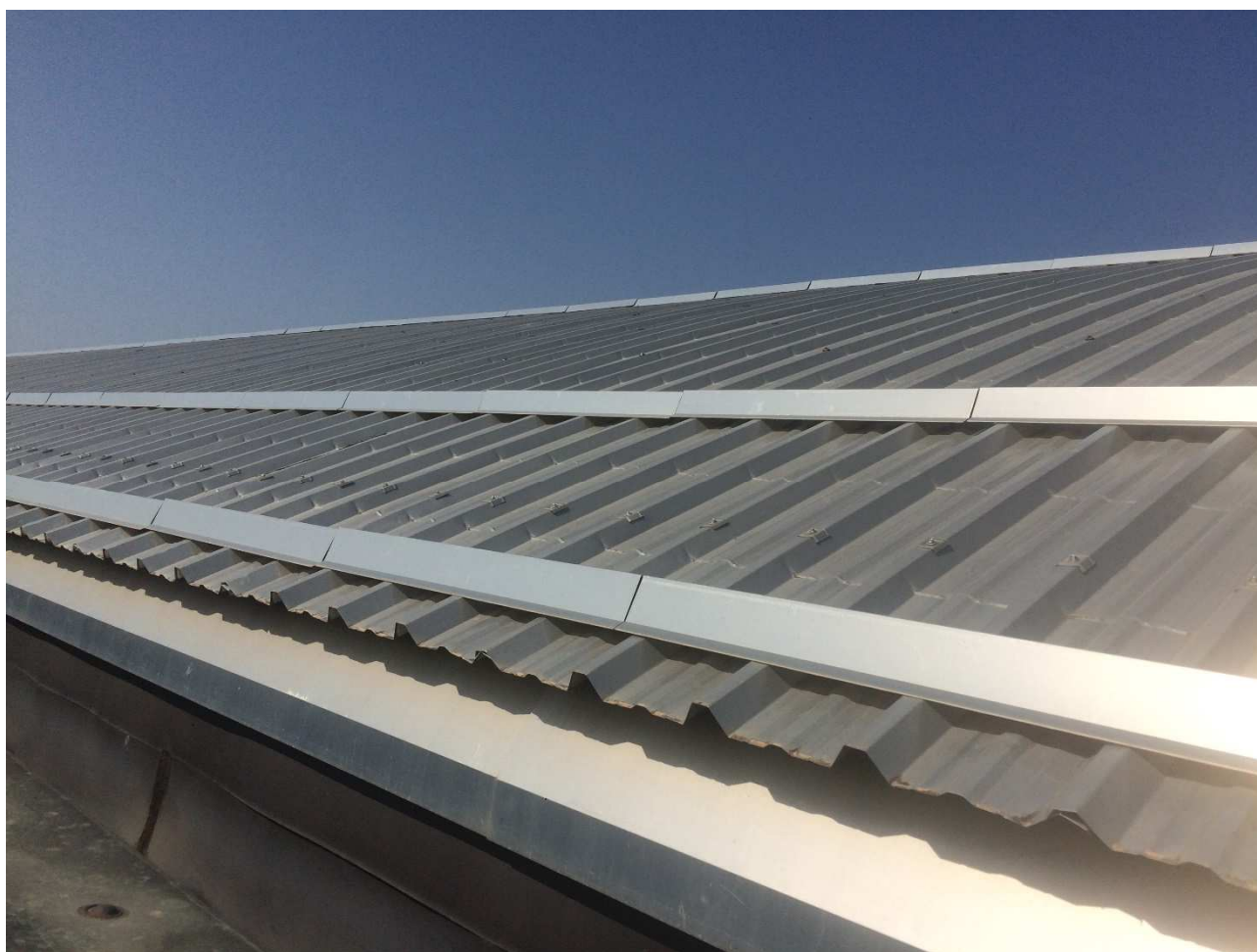
RIPRESA FOTOGRAFICA. Rivestimento esterno della copertura attuale. Pluviale prefabbricato in c.a., scossaline in rame ed acciaio di protezione, lamiera grecata e profili fermeneve sagomati in acciaio.