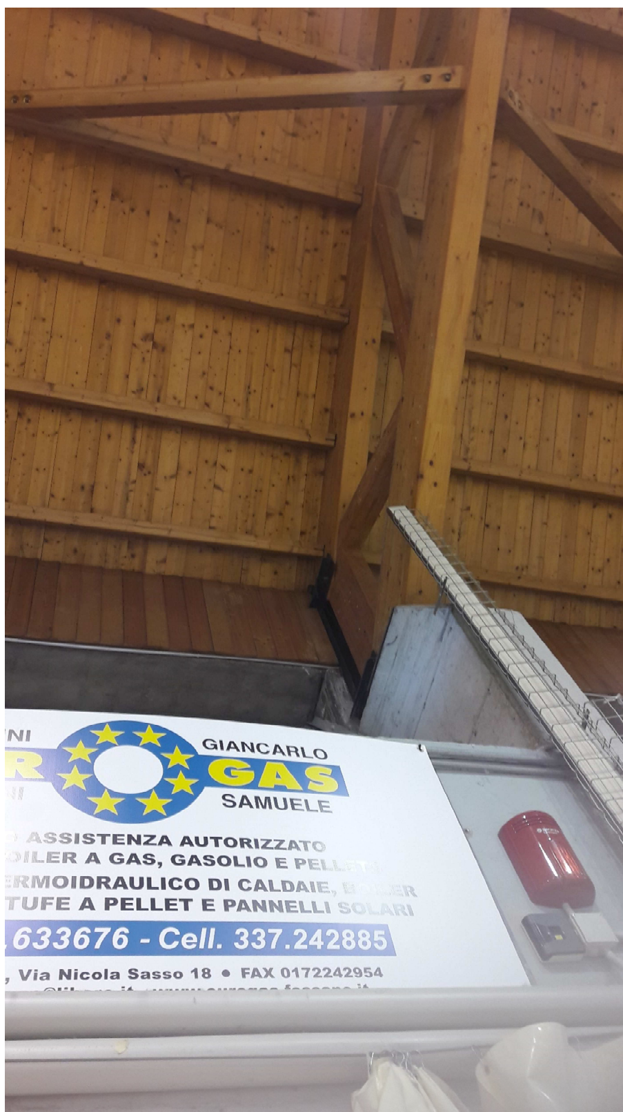
RIPRESA FOTOGRAFICA. Rivestimento interno della copertura, la quale allo stato attuale si caratterizza per un'orditura principale curva in legno lamellare, arcarecci, puntoni e perline di imposta agli strati esterni