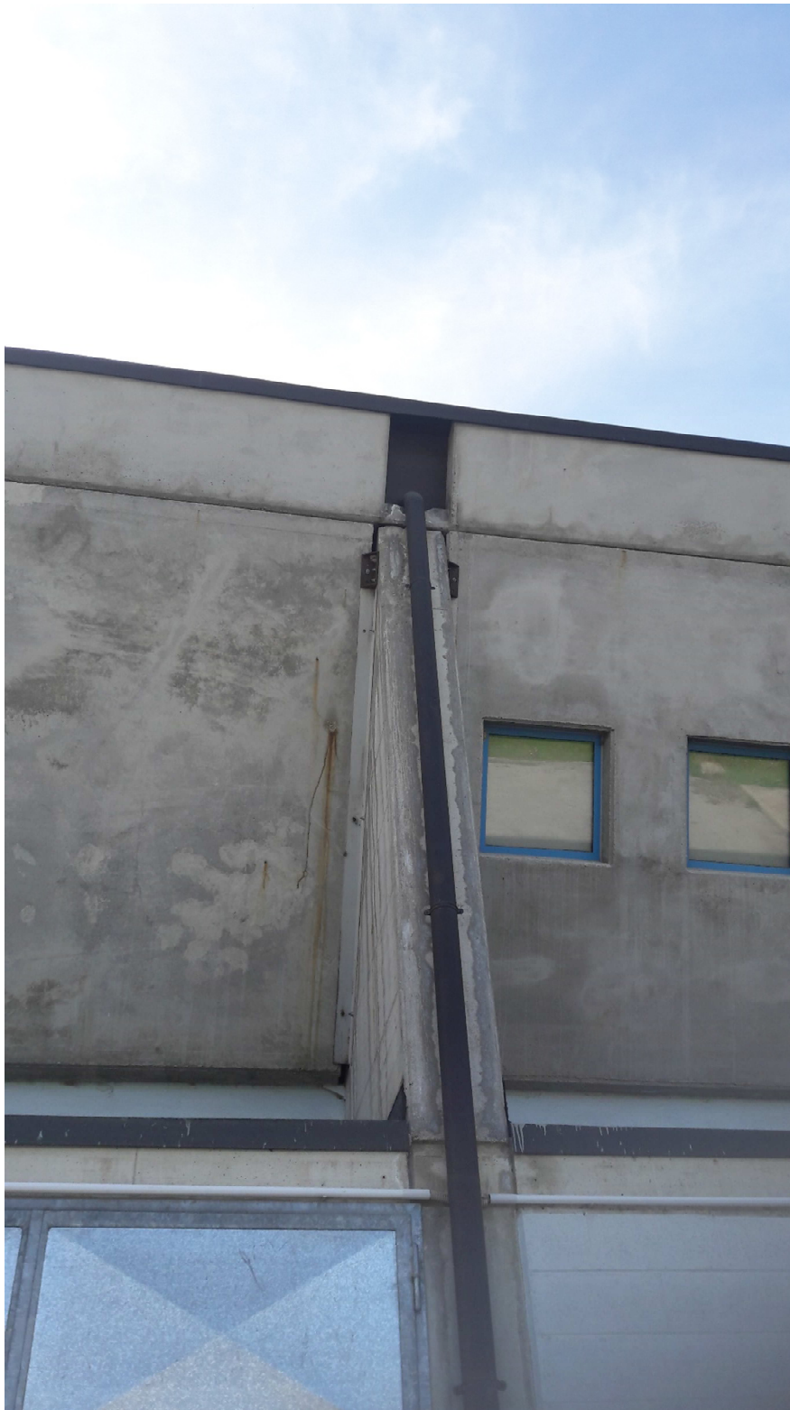
RIPRESA FOTOGRAFICA 3: Palazzetto dello sport, prospetto est. Rappresentazione del sistema di allontanamento delle acque meteoriche. Canale di gronda prefabbricato in c.a.; pluviali posti in corrispondenza dei setti in c.a..