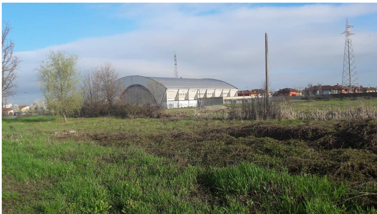
RIPRESA FOTOGRAFICA 4: Palazzetto dello sport, prospetto est.