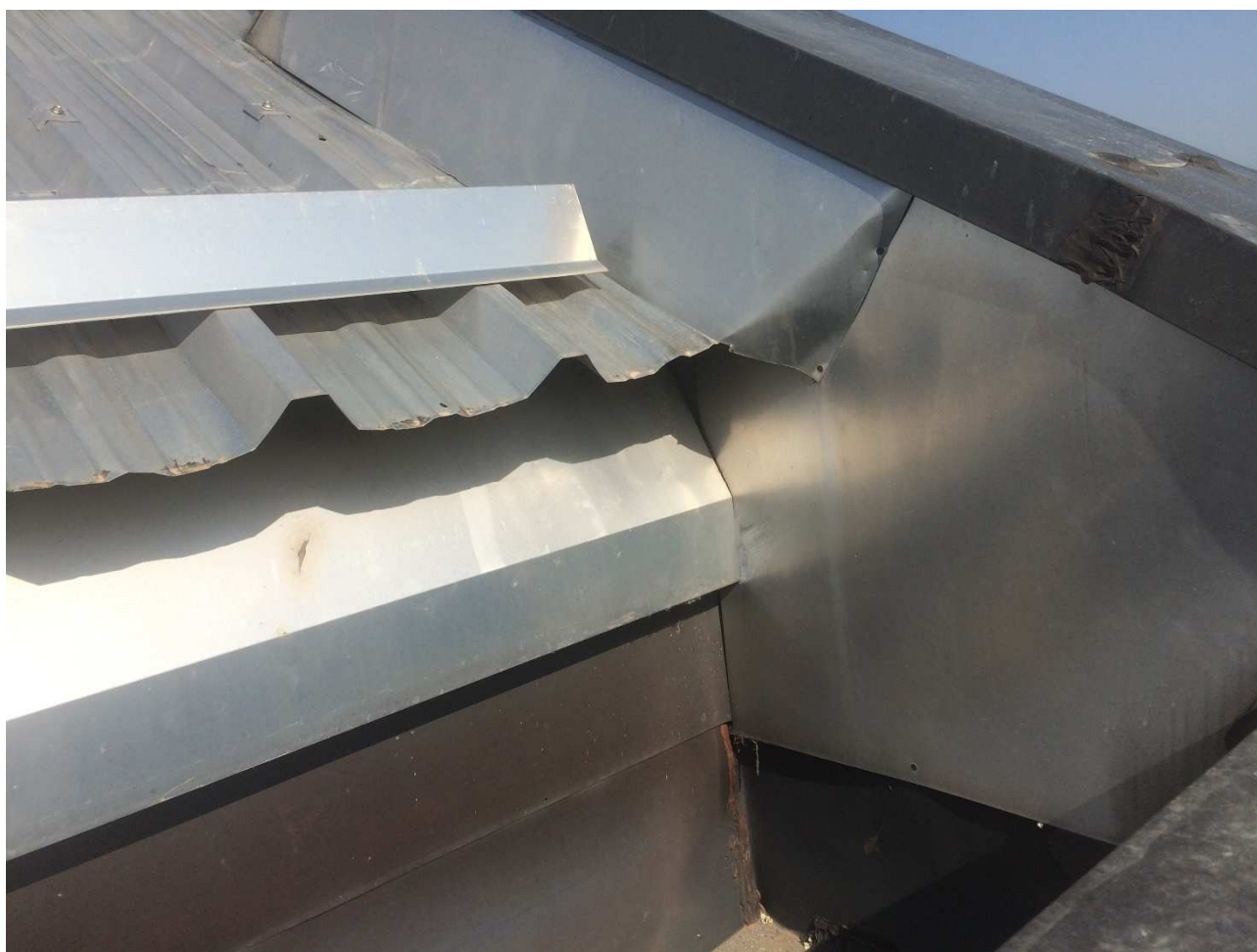
RIPRESA FOTOGRAFICA. Rivestimento esterno della copertura attuale. Pluviale prefabbricato in c.a., scossaline in rame ed acciaio di protezione, lamiera grecata e profili fermaneve sagomati in acciaio.