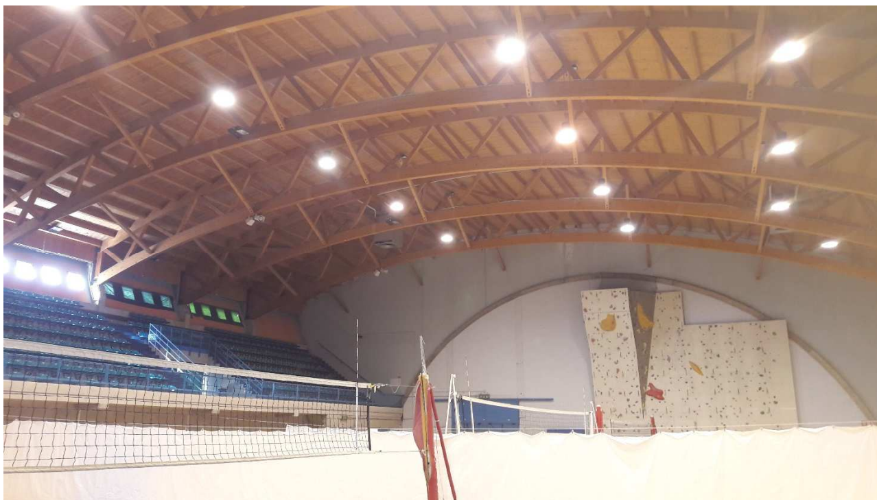
RIPRESA FOTOGRAFICA. Rivestimento interno della copertura, la quale allo stato attuale si caratterizza per un'orditura principale curva in legno lamellare, arcarecci, puntoni e perline di imposta agli strati esterni.