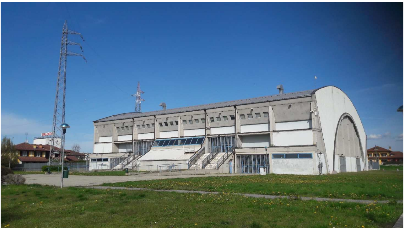
RIPRESA FOTOGRAFICA 1: Palazzetto dello sport, prospetto ovest.