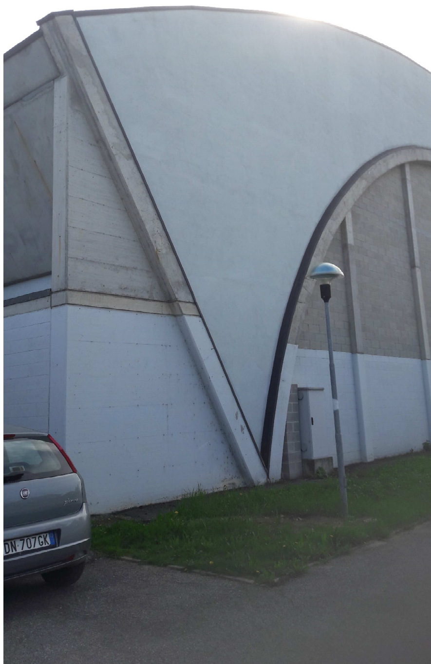
RIPRESA FOTOGRAFICA 2: Palazzetto dello sport, prospetto nord.